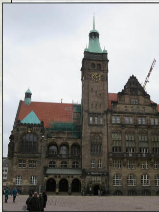
© Ewald Judt CC BY 4.0